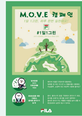
'1일 1그린 M.O.V.E 캠페인' 포스터