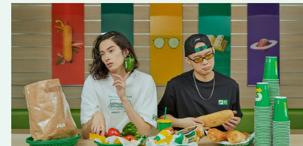
휠라 X 서브웨이(Subway) 광고

휠라는 글로벌 샌드위치 브랜드인 서브웨이(Subway)와의 협업을 통해 '휠라 X 서브웨이 콜라보 컬렉션'을 출시하며 리사이클 페이퍼를 활용해 제작한 운동화와 친환경 소재의 가방을 선보였습니다. 당사는 다양한 크리에이터들과 협력하여 휠라의 새로운 컬렉션을 소개하고 온·오프라인 언택트 프로모션을 통해 고객들과 직접 만나며 친환경 제품의 소비를 활성화하고 친환경 메시지를 전달하고자 노력하였습니다. 또한 당사는 일회용품 사용 비율을 줄이기 위해 해당 제품의 구매고객들을 대상으로 '리유저블 텀블러'를 증정하여 환경친화적인 활동을 이어나갔습니다. 이처럼 당사는 친환경적이면서 가치 있는 소비를 중요하게 여기는 고객들을 위해 환경적 가치 창출을 목표로 자원 선순환 구조를 만들어 나가고 있습니다. 앞으로도 당사는 영향력 있는 친환경 단체, 인플루언서, 업사이클링 브랜드 등과 다양한 콜라보레이션을 진행하며, 당사의 스테디셀러 제품에 친환경 메시지를 담아 소비자들께서 자연스럽게 친환경 활동에 동참할 수 있도록 유도하겠습니다.